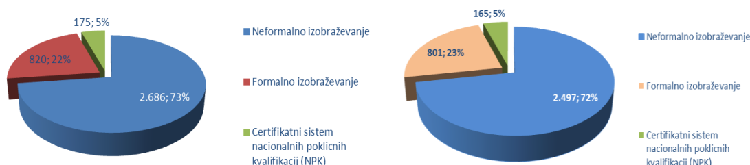
Grafa 2: Število izobraževalnih programov za odrasle po vrstah izobraževanja v šolskih letih 2015/16 in 2016/17: