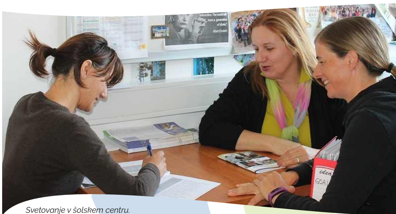
Svetovanje v šolskem centru.

c. Utrjevanje odločitve: identifikacija z izbiro in izvedbo