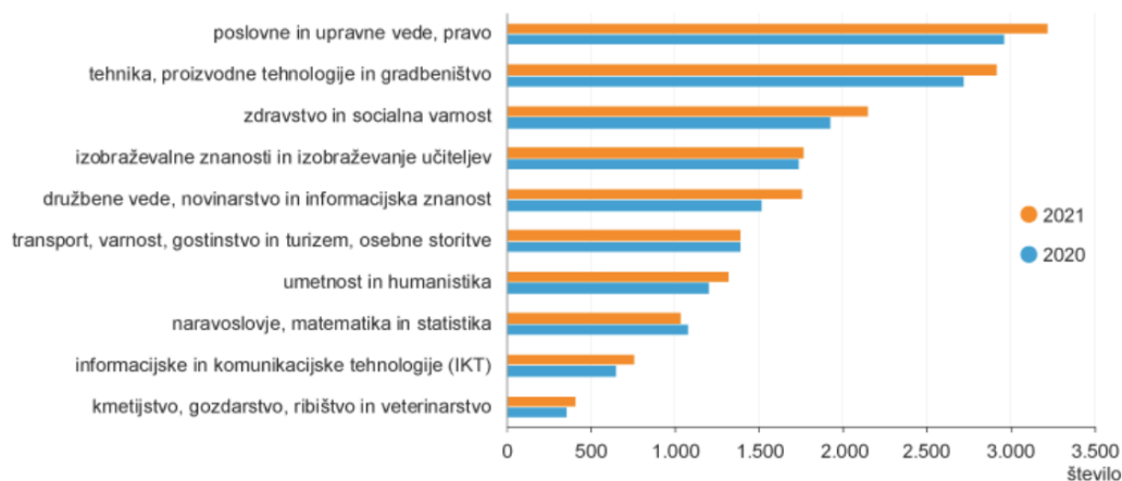
Graf 3: Diplomanti terciarnega izobraževanja po področju izobraževanja (KLASIUS-P-16) v letih 2021 in 2022

Število diplomantov pa se je v tem letu najbolj povečalo na področju Informacijske in komunikacijske tehnologije (IKT) (16,2 %) ter Družbene vede, novinarstvo in informacijska znanost (15,8 %) (Graf 3).