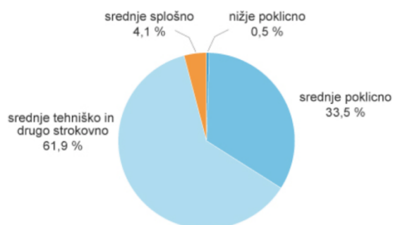
Graf 1: Odrasli v srednješolskem izobraževanju po vrsti izobraževanja, 2020/21