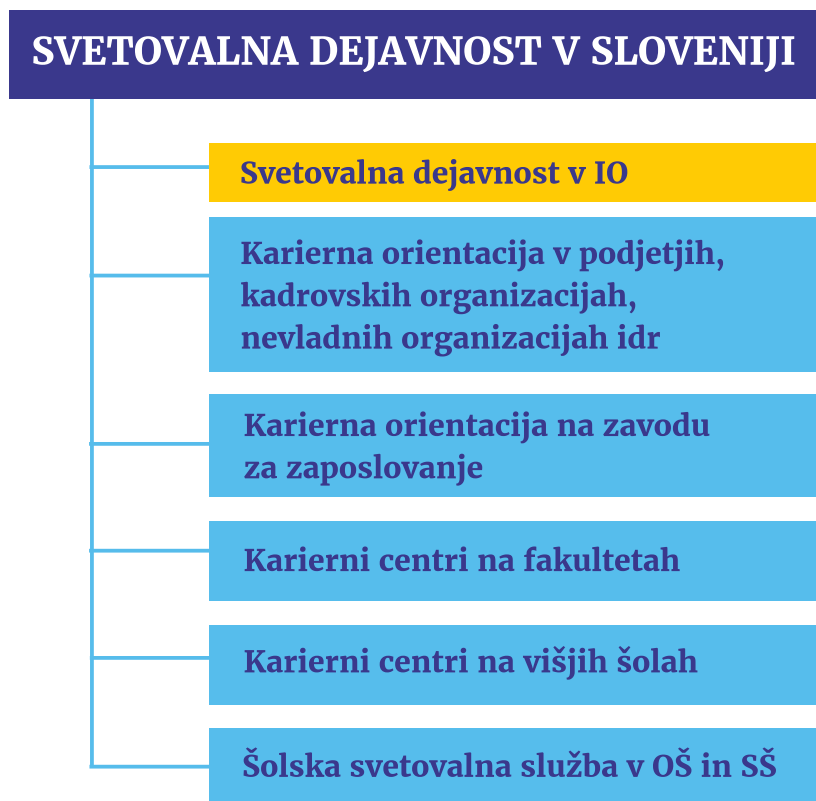
Slika: Umestitev svetovalne dejavnosti v IO v Sloveniji 17