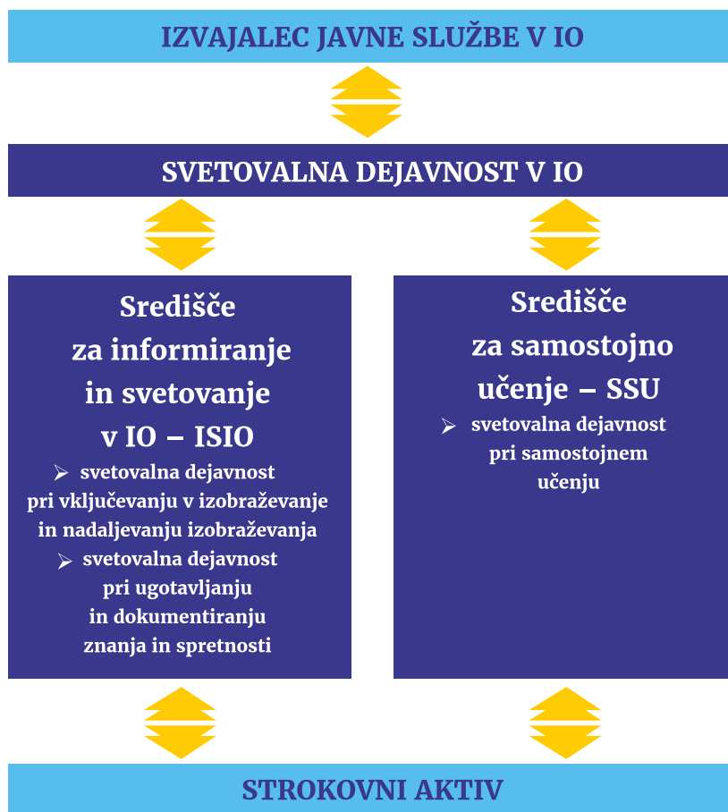
Slika 2: Organizacijska shema svetovalne dejavnosti v IO

Svetovalno dejavnost v IO lahko izvajajo izvajalci javne službe v IO. Svetovalno dejavnost umestijo v organizacijsko shemo, kot je na primer razvidno s slike 2.