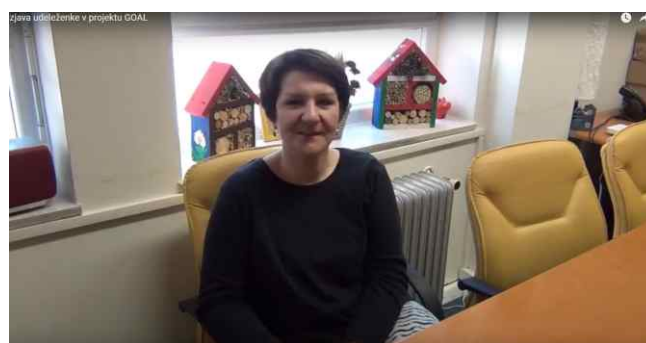
Uspešna zgodba – izjava udeleženke v projektu GOAL, objavljena v video filmu (september 2017)

https://www.youtube.com/watch?v=PA4KAVHSHCU&feature=youtu.be