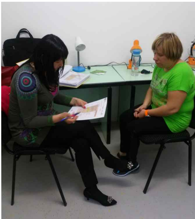
▲ V projektu GOAL smo svetovanje na delovnem mestu izpeljali v podjetju RUJ

Izkušnje iz predstavljenih oblik terenskega dela so potrdile, da je izvajanje terenskega dela najučinkovitejše, ko strokovni delavec – svetovalac s ciljno skupino vzpostavi partnerski odnos v okolju, v katerem živijo in/ali delajo, ter ko aktivnosti in ukrepe načrtuje na podlagi dejanskih potreb. To pa pomeni tudi, da svetovalac predstavnike iz izbrane ciljne skupine vključuje v analizo potreb ter pripravo aktivnosti in ukrepov, lahko pa tudi v njihovo neposredno izvajanje . S tem prispeva k njihovemu opolnomočenju , da so dejavnejši ustvarjalci svoje nadaljnje izobraževalne in/ali karijerne poti , o čemer pišemo tudi v točki 2.1.